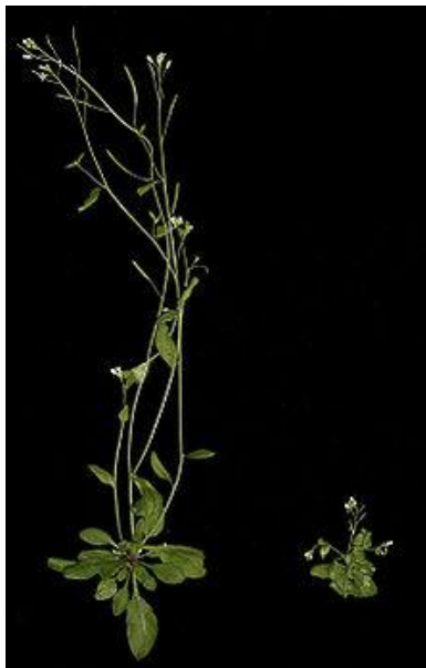
Arabidopsis thaliana , levo z normalnim nivojem auxinov. Desno posledice agensov, ki zavirajo auxine..

AUXINI - So rastlinski hormoni, njihovo grško ime auxein pomeni rastem hitro . Igrajo osrednjo vlogo pri rasti in razvoju celotne rastline.